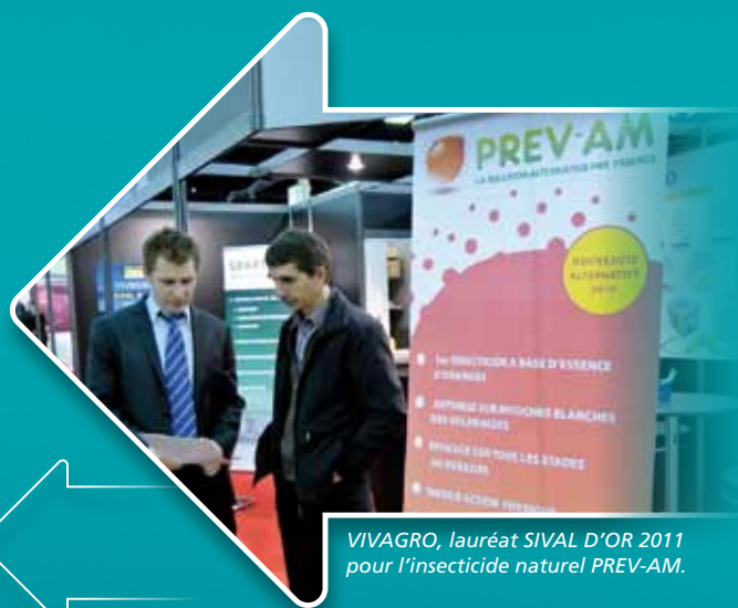
VIVAGRO, lauréat SIVAL D'OR 2011 pour l'insecticide naturel PREV-AM.